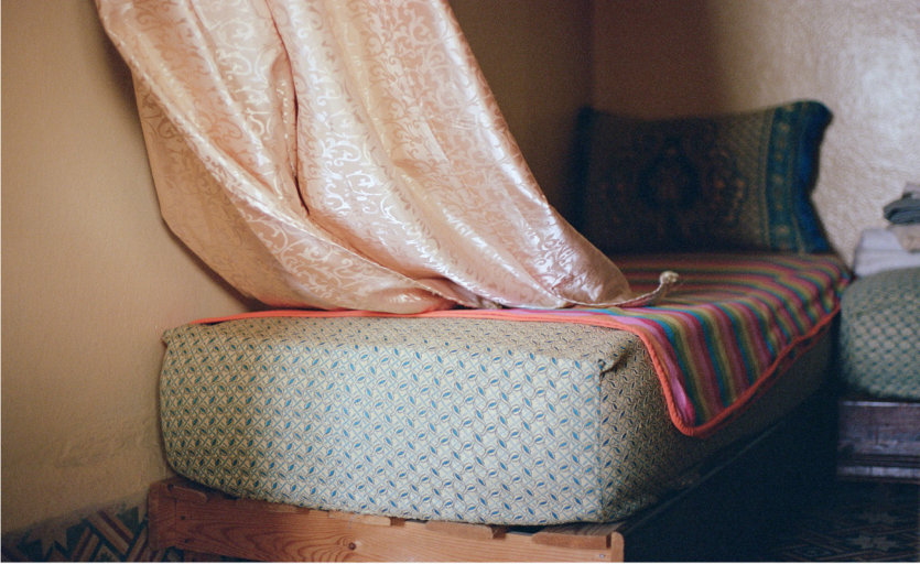
Charlotte EL Moussaed, 1, série Remedios , 2026